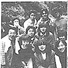
教職サークルのメンバーたち

教員養成の道は、知識の習得だけでなく、実践的な経験と人間的成長を必要とする。教職サークルを通じて、仲間と共に学び、成長していく。